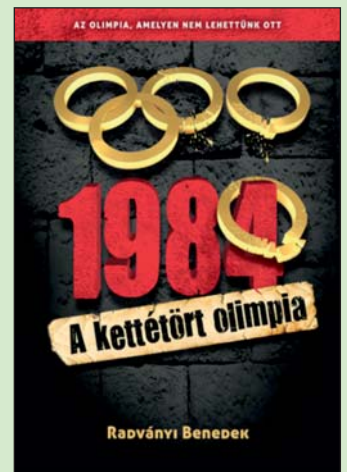
Mire ment a világ az olimpiai bojkotokkal? Sportolók jelenét, jövőjét, életét tette tönkre.

Az meg sem fordul a csörgősípkás ember fejében, hogy van, aki komolyan gondolja: bakot lő a nagypolitika, ha úgy okoskodik, a megcsonkított olimpiával bármi elérhető. Frászt. Az egész csak arra jó, hogy belevesse a sport nagyszerűségében még bízó emberekbe: a politika számára nincs szent eszme. Voltak itt már bojkottolimpiák – Moszk-