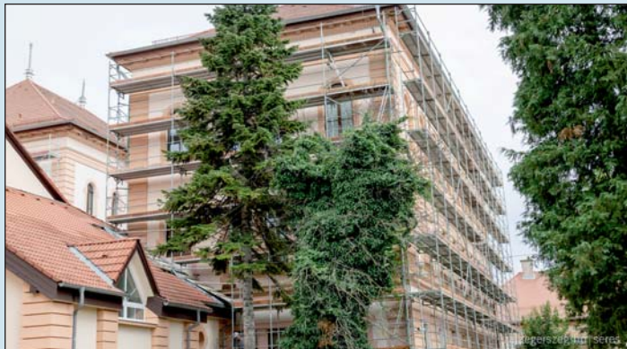
677 millió forint a felújítás költsége.

tottuk a Liszt iskola tornatermét (66 millió Ft), megvalósult a Széchenyi István Technikum felújítása (686 millió Ft), ősre pedig elkészül az Apáczai tornacsarnokának felújítása (250 millió Ft) és a Deák Ferenc Technikum felújítása (372 millió Ft) is.