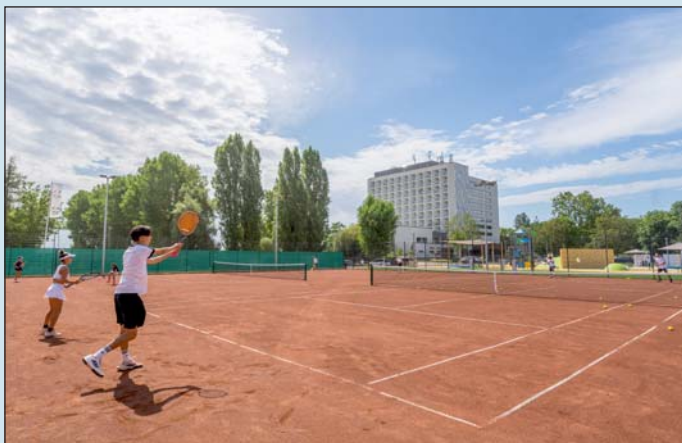
Újabb hat pályát adtak át Keszthelyen.

A kapitányok szeptember első hetéig adhatják le a nevezéseket a DK-osztályozóra.