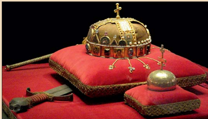
A koronázási ereklyék.

A rendszer összeomlását megelőző esztendőben aztán újra polgárjogot nyert az ál-