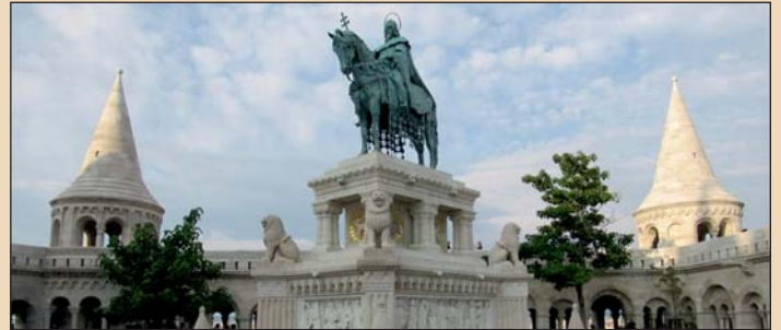
Szent István szobra a fővárosban.

Allamalapító szent királyunk ünnepének kultusza a Horthy-korszakban teljesedett ki igazán. Ezen a napon fényes állami ünnepek zajlottak tisztavatással, ünnepi körmenettel, gyöngyösbokrétás felvonulással, tűzijátékkal, a Várnegyedben tartott színes vásárral. Kiemelkedően fontos jellemzője volt a napnak, hogy a szentkirály ünnepe túlnőtt a felekezeti megosztottságon. A körmenet valójában a ka-