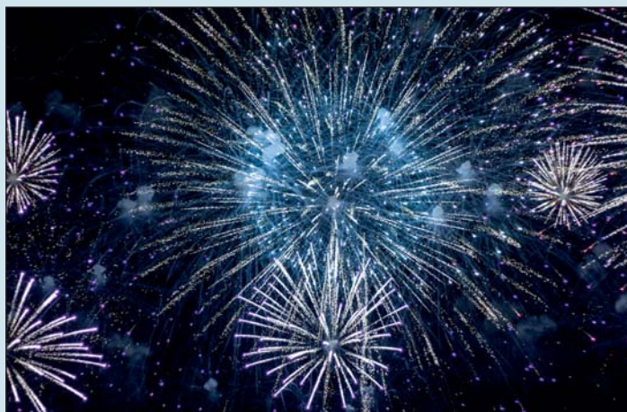
Ha betiltják a tűzijátékot, Pethőhenyén sem tartanak. (A fotó illusztráció.)