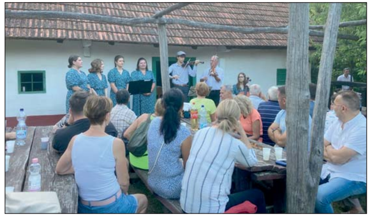
A Völgyi zenekar előadása.