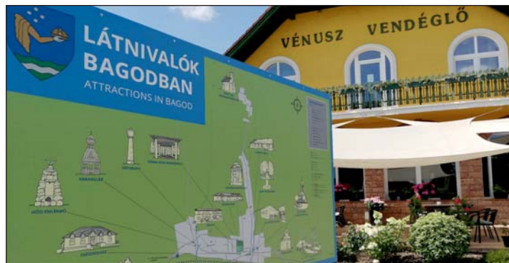
A településközpontban elhelyezett térkép.

Bagod abban a szerencsés helyzetben van, hogy gazdag történelmi múlttal, rengeteg történelmi érdekességgel rendelkezik, melyek mind-mind nyomot hagytak községünkben. Am többükről hiányos információink lehetnek, esetenként talán egyáltalán nem tudunk róluk.