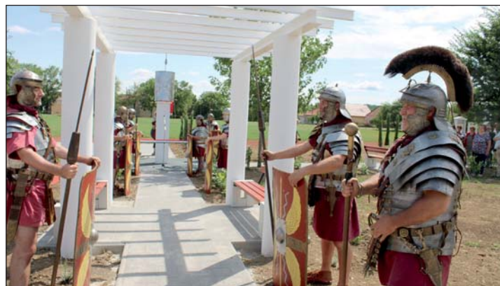
Ókori bemutató- és pihenőhely a Bagod területén valaha élt emberek emlékezetére.

Az elültetett 11féle növény a Római Birodalomban anno közkedvelt, őshonos, napjainkra természetesen már nemesített fajta. Buzdítjuk lakóinkat, látogatóinkat, szedjék, gyűjtsék azok virágát, termését, hiszen többek közt ezért is válasz-