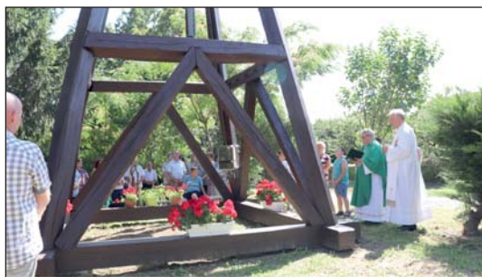
A dedesi harangláb megáldása és falunap Irsapusztán...