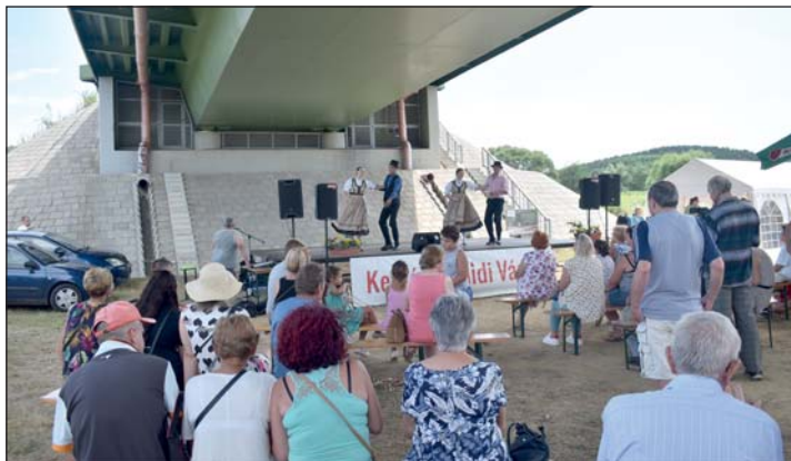
Idén is benépesült a híd alatti rét.

Keménfa Község Önkormányzata köszöni mindenki részvételét, bízva abban, hogy jövőre ismét találkozunk!