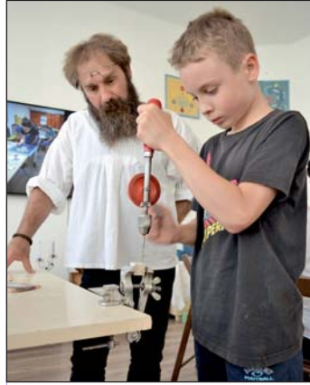
Fából készült a dobókocka.

Az idei nagylengyeli dombérozás második felvonása külön-