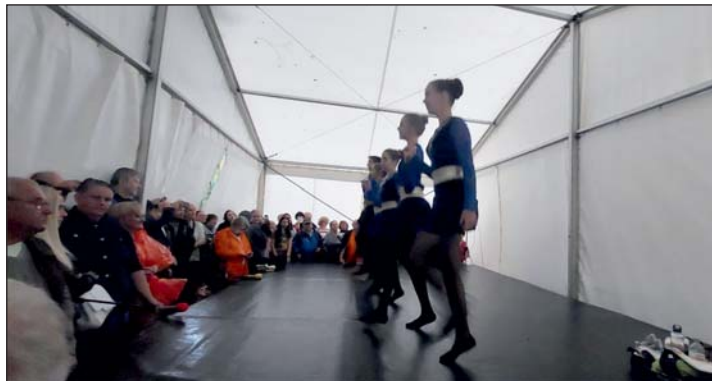
Skótdudás és a Kelta táncgyűttes fellépése.

A bölcsőde külön történet. Az egyháztól ingatlancsere révén jutottunk hozzá ahhoz az épülethez, amelyet kétszoportos bölcsődévé szeretnénk átalakítani. A növekvő gyermeklétszám, a várólista miatt most erre van szükség. Az ingatlan megszerzése azért is lett kiemelt feladat, mert teleksszomszédos az óvodával, így a település közepén kialakíthatóvá