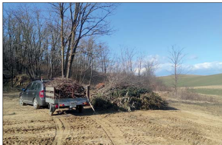
Jól működik a zöldhulladék lerakására kialakított terület.

Szintén jól működik a zöldhulladék lerakására kialakított terület, mely nagy segítségére van a lakosoknak, és jó irányba lehet a település „füstmentessé” tételének. Többen élnek az önkormányzat által felkínált beszállítási lehetőséggel is. A te-