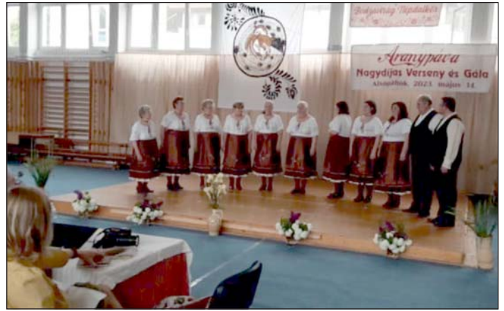
Nagy sikert értek el...