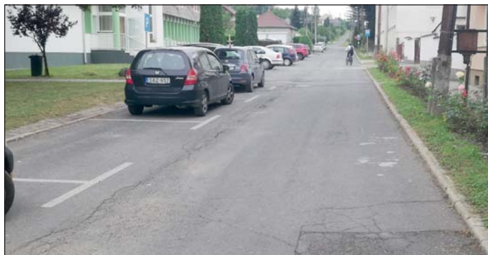
Felújításra kerül a Rákóczi utca alsó szakasza.

A „Belterületi közút fejlesztése Zalalövön” című (Rákóczi utca felújítása) pályázathoz kapcsolódó kivitelezési munkák elvégzésére beérkezett árajánlatokat elbírálta a testület. Hamarosan sor kerül a szer-