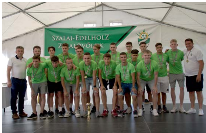
Az aranyérmes ZTK U19 labdarúgócsapata.