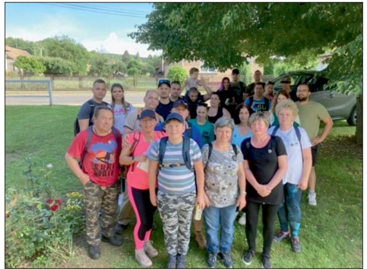
A győztes csapat az Éjszakai sajt@-ok.

Az idei év a jubileumé volt, újra élő állomásokon kapták a feladatot a csapatok. A hét állomás, tizenkettő feladatát kellett megoldani, a 19 résztvevő csapat több mint 300 száz résztvevőjének. Az öt élő állomáson a feladatok kiosztásában több mint 50-en segítettek. A távot közel 4 óra alatt lehetett teljesíteni. A túra ritmusa fel a hegyre, le a hegyről, fel a hegyre, le a hegyről. A rajt-cél állomás a spotpályai közösségi háznál volt. Szabó hegyen, Vaskó hegyen, Bükk hegyen, Zsimba hegyen és Zsidóhegyen voltak állomások. Két völgyben vak állomásokon kellett feladatokat megoldani. Minden év tartogatott váratlan nehézségeket, idén egy osztály tévedt el. A polgárőr-mentés terelte őket a „helyes” útra. Nagyon küzdöttek a csapatok helyezésekért,