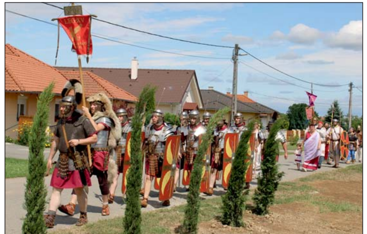
„Hagyományörzők a falu utcáin, előtérben Itália jellegzetes nővényével, az Olasz ciprussal.”

– felavattuk az ókori római szabadtéri bemutatóhelyünk bővítését – egy 2 méter magas posztamensen elhelyezett korabeli pajzs és nehézgerely közötti (Folytatás a 2. oldalon)