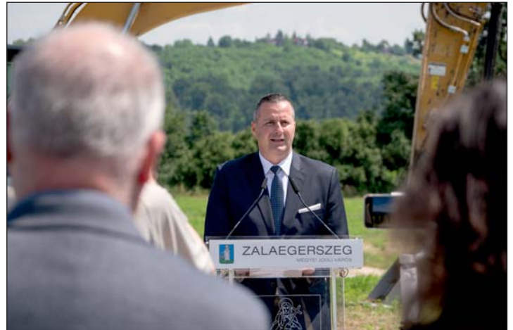
Balaicz Zoltán kiemelte, hogy az elmúlt években folyamatosan fejlődött Zalaegerszeg gazdasága.

– Az elmúlt években folyamatosan fejlődött Zalaegerszeg gazdasága. Amikor 2014-ben a jelenlegi városvezetés megkezdte a munkát, első és legfontosabb feladatának a gazdaság fejlesztését és az új munkahelyek létrehozását tartotta. Az elmúlt 9 évben több tízmilliárd forint értékben valósultak meg beruházások és 4.400 új munkahely jött létre. A munkanélküliség aránya a 2014-es 7,5 százalékról 2023-ra 2,5 százalékra csökkent. A város helyi iparüzési adóbevétele (a gazdaság fejlődésének egyik legjobb fokmérője) 100 százalékkal nőtt, megduplázódott: 2014: 3 milliárd Ft, 2019: 4 milliárd Ft, 2023: 6 milliárd Ft. Az eddigi információink alapján 2024 végéig további 1.700 új munkahely jön még létre. Olyan gazdasági ökoszisztéma alakul ki Zalaegerszegen, ahol jelen van és összekapcsolódik a termelés, a kutatás-fejlesztés, az innováció, a szakképzés, az egyetemi oktatás, valamint a különféle szolgáltatások – összegezte a gazdasági fejlődést Balaicz Zoltán, Zalaegerszeg polgármestere.