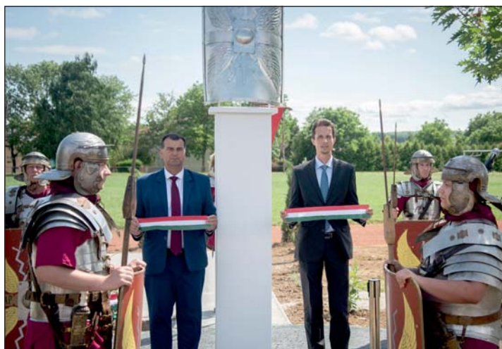
Felavatták a római szabadtéri bemutatóhely bővítését.