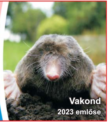
Vakond 2023 emlése