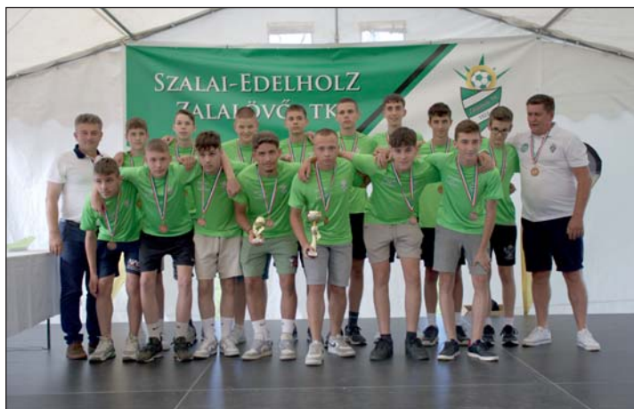
A bronzérmes ZTK U16 labdarúgócsapata.