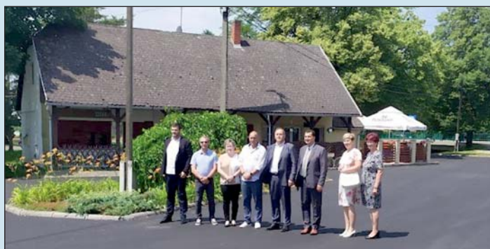
A résztvevők a felújított Deák Ferenc utcában.