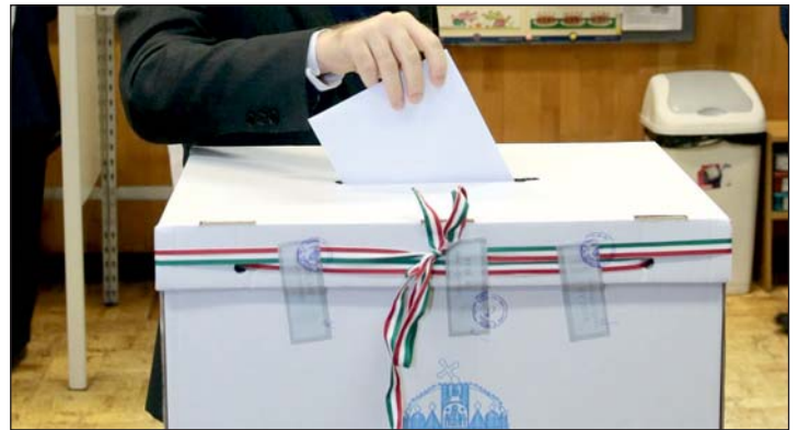
Július 9.-én polgármestert választanak Alsórajkon.

Telefonon kerestük a polgármestert, hogy lemondásának okairól kérdezzük, de lapzártaig nem tudtuk elérni.