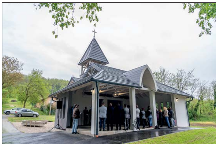
Pályázati forrásból újult meg a ravatalozó.