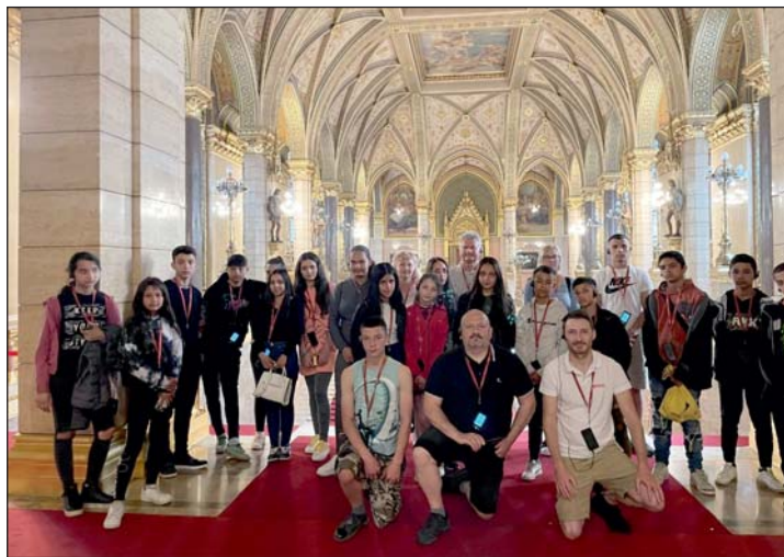
Felejthetetlen élménnyel lettek gazdagabbak.

Május végén a Szentpéterúri Általános Iskola felső tagozatos diákjai egy komplex program keretében voltak a magyar Parlament vendégei. A kirándulás a településen működő Magyar Máltai Szeretetszolgálat szervezésében való-