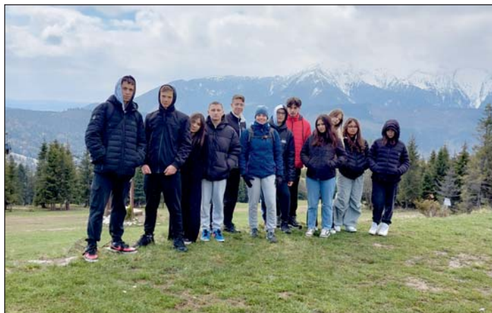
A Magas-Tátra Zárban található tanösvényén.

Második nap a Szepesség történelmi városait, Lőcsét és Késmárkot néztük meg, ahol történelmi, földrajzi, építészeti és kulturális ismeretekre tehetünk szert. Lőcsén az óváros ódon épületeit csodálhattuk meg, Késmárkon Thököly Imre sírját koszorúztuk meg, illetve az UNESCO világörökség részét alkotó evangélikus fatemplomot nézhettük meg. A nap második felében a Csorba tavat látogattuk meg, mely 1346 méter tengerszint feletti magasságon található. A hideg időnek köszönhetően a tó befagyott, szép panorámáját nem láthattuk, de lehetőség adódott