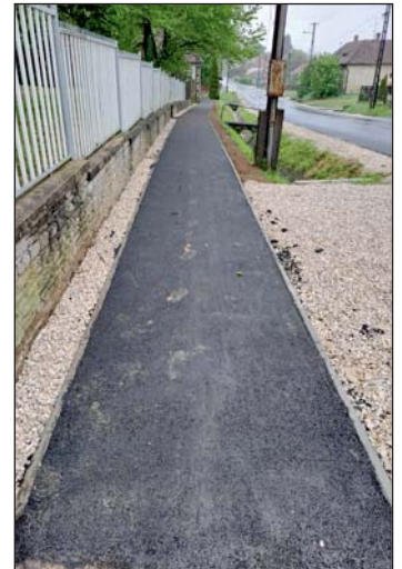
A felújított járda Csány utcában.

denképpen folytatása várható. A munkálatok idejére tanúsított türelmüket Pacsa Város Önkormányzata nevében megköszönöm.