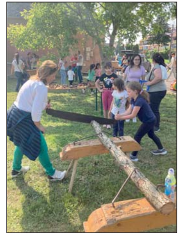
„Húzd meg jobban, menjen a munka”...