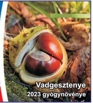
Vadgesztenye 2023 gyógynövénye