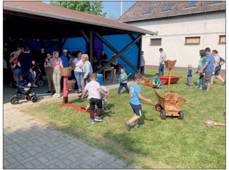
Nagy sikerük volt a népi fajtékoknak.

Mint minden rendezvényen, a tűzoltó autó most is közkedvelt volt, köszönjük az Önkéntes Tűzoltóegyesület közreműködését. A Városszépítő Egyesület tagjai egész délután süttették a palacsintákat, melyhez az alapanyagot szintén ők hozták. Kakaós, lekváros, fahéjas ízesítésűt kaptak a gyerekek. Aki a sok játék közben