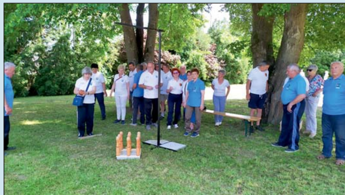
Hetedik alkalommal került sor a versenyre.