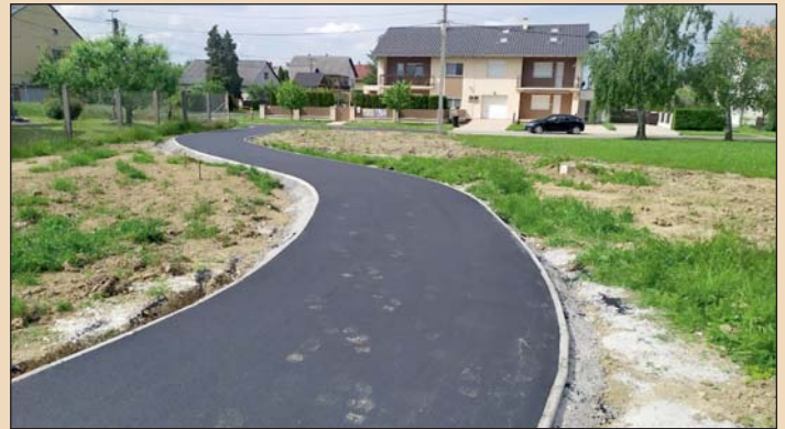
Az elkészült összekötő szakasz látványa.