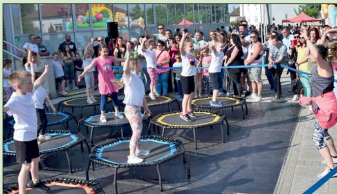
Az óvodások fanatic jump bemutatója.

Lentiben a pünkösdi hétvégén gyereknapi programmal várták az érdeklődőket a Templom térre. A szabadidős játékpark és népi játszótér, valamint mozgásművészeti és