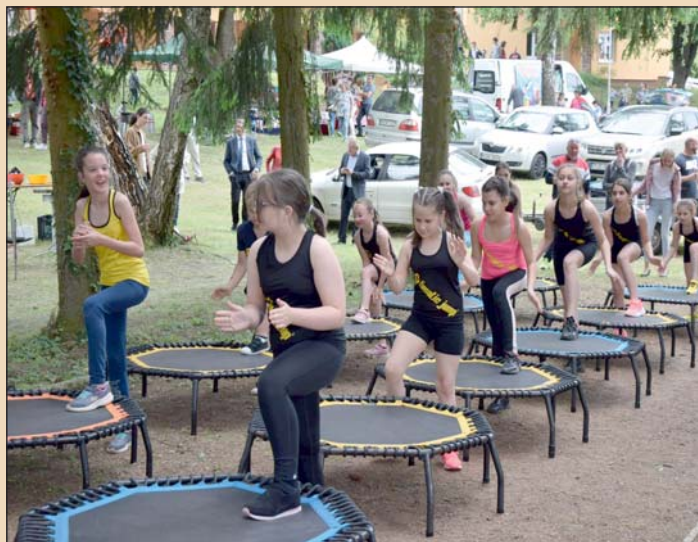
Játékos vetélkedő a gyermekeknek.

Délután helyi és vendég zenés fellépők, táncscsoportok szórakoztatták a közönséget.