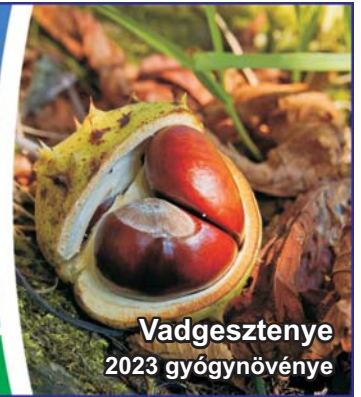
Vadgesztenye 2023 gyógynövénye