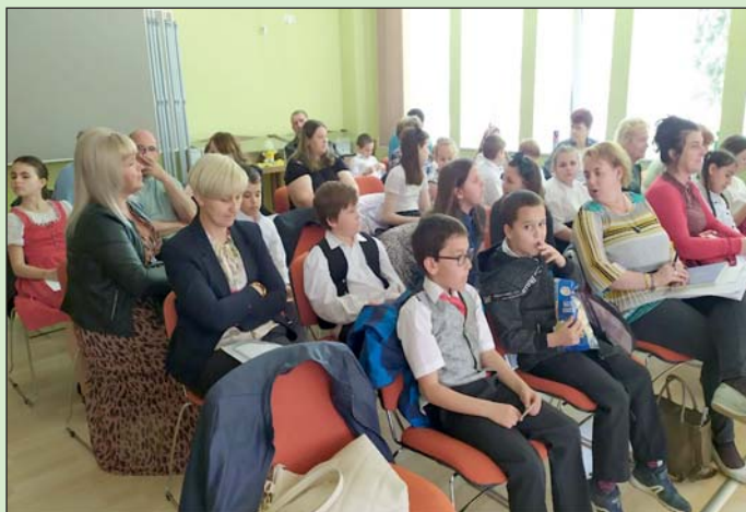
A mesemondó verseny résztvevői.