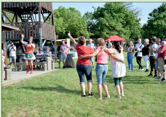
Sissi fellépése a novai rendezvényen.

A fenti programok mellett kihirdették a nemrégiben megrendezett, nemzetközivé lett bormustra eredményeit is és kiosztották az okleveleket.