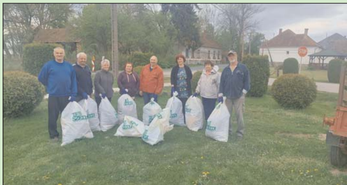
Az akció néhány résztvevője Külsősárdon.

az elszórt hulladéktól, illetve a szeméthyűjtés mellett társadalmi munkában újra letertkövezték a kultúrház előtti részt, ahol a burkolat javításra szorult. Emellett a tervek szerint felelevenítik a májusfálítás hagyományát, ehhez is előkészítették terepet, lebetonozták az alapot.