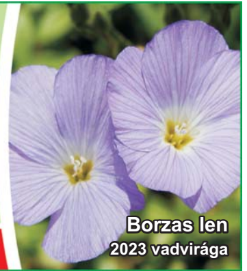
Borzas len 2023 vadvirága