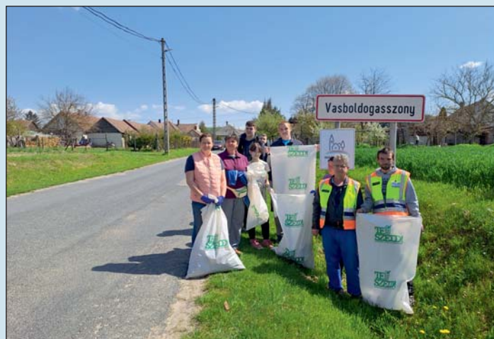
Hulladékszedő önkéntesek Vasboldogasszony határában néhány nappal ezelőtt.

– A legkritikusabb helyszíneink továbbra is felszámolásra várnak: Cserszegtomaj-Keszthely volt okkerbánya; T.J.L. Gumirec Lenti, zajdai laktanya területén gumi hulladék; Nagykanizsa, Principális-csatorna környezete. Utóbbi időben változás történt Lenti esetében. A jegyző véglegessé vált döntésében visszavonta a T.J.L. Gumirec Kft. telepengedélyét, majd hatóságunk a törvényes feltételek hiánya miatt visszavonta a cég hulladékgazdálkodási engedélyét. A mi visszavonó engedélyünk is véglegessé vált. Ebben a döntésünkben 2023. június 30-ig adtunk határidőt a telep felszámolására, illetve a hulladék teljes elszállítására, az eredeti állapot visszaállítására. A cég előéletét ismerve féltő, hogy itt