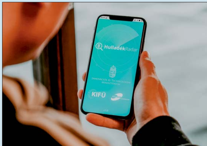
Egyre többen használják a hulladék-radar applikációt.

bevezetett szigorítások nagy terhet rónak az önkormányzatokra, illetve az állami tulajdonú ingatlanok vagyongazdálkodására. Tudomásunk szerint a jelenlegi szabályozással szemben az önkormányzatok érdekvédelmi szervei (TÖOSZ, társulási tanácsok) is felléptek, észrevételeket fogalmaztak meg. Ugyancsak zajlanak egyeztetések a különböző ágazati minisztériumhoz tartozó vagyongazdálkodók esetében. Osztályunk szakmai véleményét és álláspontját közölte a minisztériummal, és a megnyugtató megoldást abban látánk, ha az állami tulajdonú ingatlanok esetében a vagyongazdálkodó személytől függetlenül minden esetben a hulladékgazdálkodási hatóság számolná fel az illegális hulladékot egy erre elkülönített állami pénzalapból. A tavaly megtartott budapesti szakmai értekezleten kiemelték a zalai példát, mint az országban elsőt és követendő. Előrelépés, fejlődési lehetőség azonban még számtalan területen mutatkozik. Megnőtt az illegális fémkereskedelemmel összefüggő ügyek száma a NAV-nál, illetve nálunk is. Mivel ugyanazt a cselekményt vizsgálja mindkét hatóság, ugyanazon elkövetői körrel áll szemben, így itt szintén logikusnak és eredményesnek találnánk egy összehangolt, átgondolt fellejtést, adott esetben jogi együttműködési forma keretében.