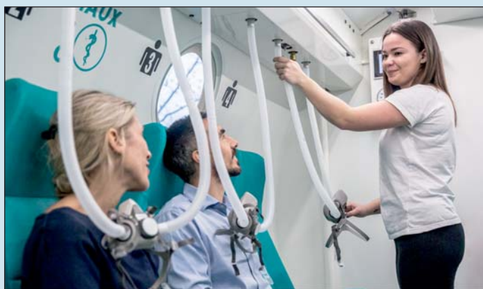
Az országban egyedülálló a berendezés.

– Gyakran alakul ki krónikus fáradtság, alvászavar, memória probléma, „agy kód”, koncentrációs probléma, szorongás, szubjektív légszomj érzés, szívritmus probléma, szag- és ízérzés zavar, fájdalom szindróma. Sok más tünetet és pszichoszomatikus elváltozást is okoz. A panaszokra eddig csak tüneti terápia létezett: