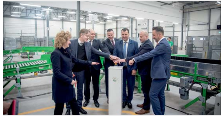
Indul a rendszer...

– Az elmúlt években folyamatosan fejlődött Zalaegerszeg gazdasága. Amikor 2014-ben a jelenlegi városvezetés megkezdte a munkát, első és legfontosabb feladatának a gazdaság fejlesztését és az új munkahelyek létrehozását tartotta. Az elmúlt 9 évben több tízmilliárd forint értékben valósultak meg beruházások és 4.400 új munkahely jött létre. A munkanélküliség aránya a 2014-es 7,5 százalékról 2022-re 2,6 százalékra csökkent. A város helyi iparüzési adóbevétele (a gazdaság fejlődésének egyik legjobb fokmérője) 75 százalékkal nőtt; 2014: 3 milliárd Ft, 2019: 4 milliárd Ft, 2023: 5,6 milliárd Ft. Az eddigi információink alapján 2022–2024 között további 1.700 új munkahely jön még létre. Olyan gazdasági ökoszisztéma alakul ki Zalaegerszezen, ahol jelen van és összekapcsolódik a termelés, a kutatás-fejlesztés, az innováció, a szakképzés, az egyetemi oktatás, valamint a különféle szolgáltatások – tájékoztatta lapunkat Balaicz Zoltán, a vármegyeszékhely polgármestere.