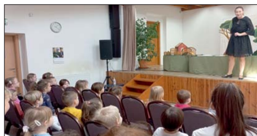
A Kalimpa Színház előadása.