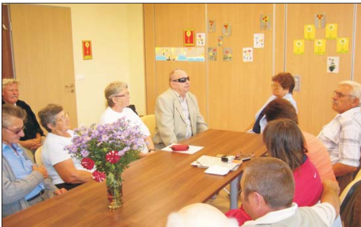
Meglepték a tagságot...