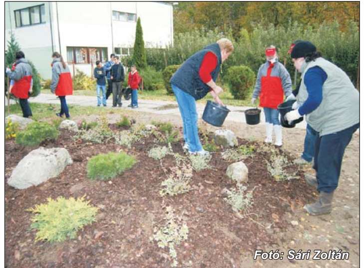
Fotó: Sári Zoltán

A lenti Móricz Zsigmond Egységes Gyógypedagógiai Intézményt 5 éve támogatja az E.ON Hungária. Iskolánk alapítványán keresztül a cég támogatásával került sor érdekelő szoba kialakítására a súlyosan, halmozottan fogyatékos tanulóink számára. Támogatásukkal lehetővé vált fejlesztő eszközök beszerzése is több százezer forint értékben. Iskolai rendezvényeinkre rendszeresen meghívást kaptak a cég képviselői.