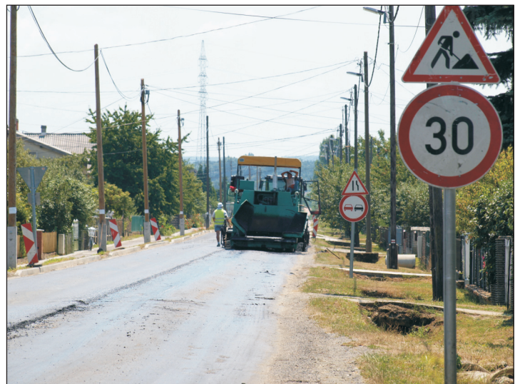
Új aszfaltréteget kapott a mumori városrészben a Damjanich út.

ton Hungary Kft. cserépgyára és a 75-ös számú főút között biztosít kapcsolatot. A folyamatos nagy terheléstől az útburkolat állapota sajnos az utóbbi időben jelentősen leromlott. A munkálatok során a teljes belterületi szakasz felújításra kerül, melynek keretében egyrétegű aszfaltszőnyeget kapott az úttest.