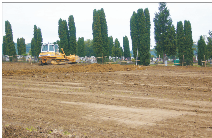
Háromszáz új temetkezési helyet alakítanak ki.

- Egy évbe telt, hogy a rendezési tervet elfogadja a Győrben székelő főépítész, és csak ezek után lehetett nekiállni a földmunkáknak. A temető bővítésében nagy segítségünkre van az Oil-